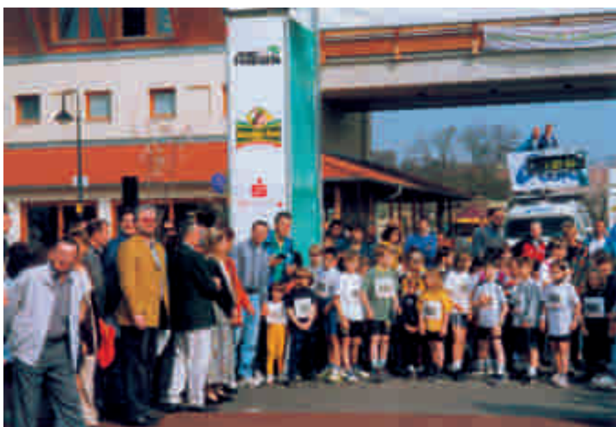
Start Bambini Lauf