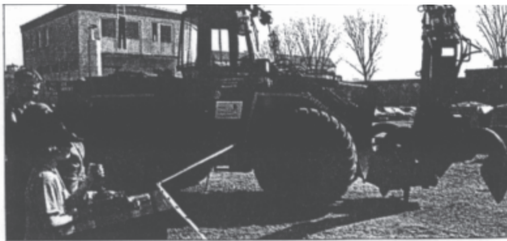
Sorgte für Spaß bei den kleinen Besuchern des Spektakels auf dem Wurstmarktplatz: Der Kran, an dem sich Linda als Führerin übte.

— weitere Berichte auf Seite 4 Sport und SOZIAL