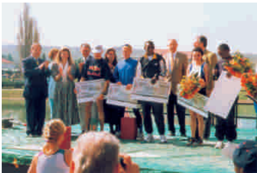
Gruppenbild der Gesamtsieger Männer und Frauen von Platz 1-3