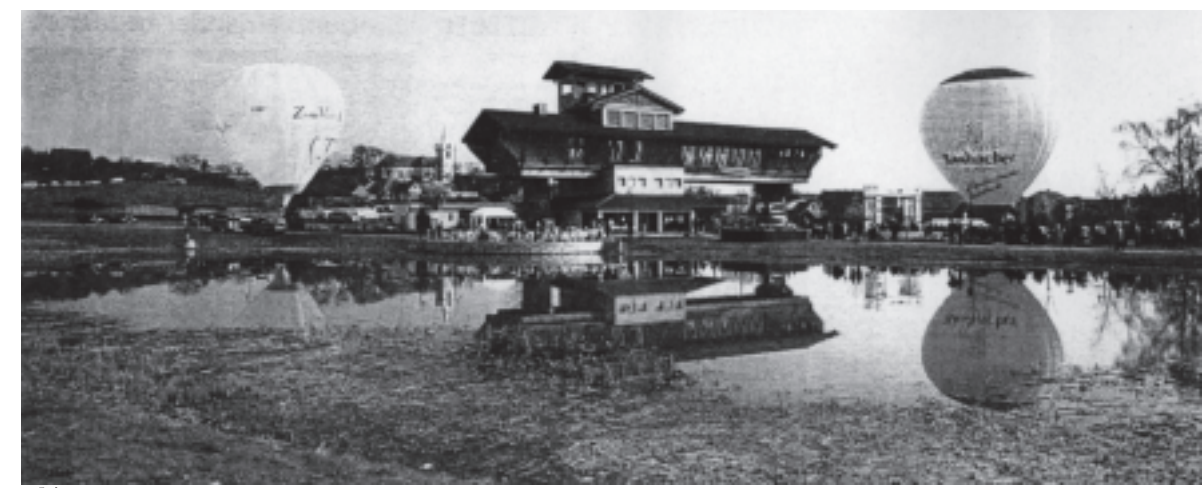
1998: Die kleine Saale, die nach der März-Überflutung vom März (Planung nach Osttag) platziert