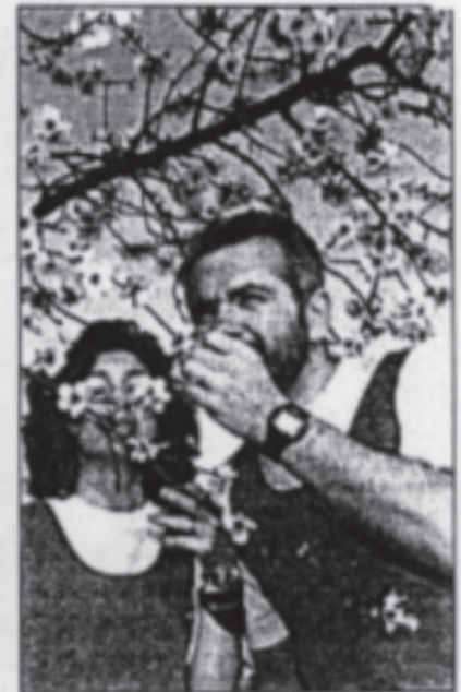
„Natur-Doping“: Läufer der TG Maxdorf Maxdorf schnuppern an Mandelblüten.