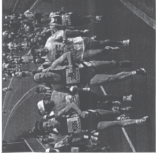
Zu Fuß durchs Land der Koblenz-Marathon. Das Bild zeigt die Teilnehmer des Land- und Luft-Marathons in Neustadt an der Weinstraße.

„Ich habe das Gefühl, als hätte ich einen Marathon gelaufen. Die Strecke ist sehr schön und die Teilnehmer sind sehr freundlich. Ich bin sehr stolz auf mich und auf alle Teilnehmer. Die Strecke ist sehr schön und die Teilnehmer sind sehr freundlich.“