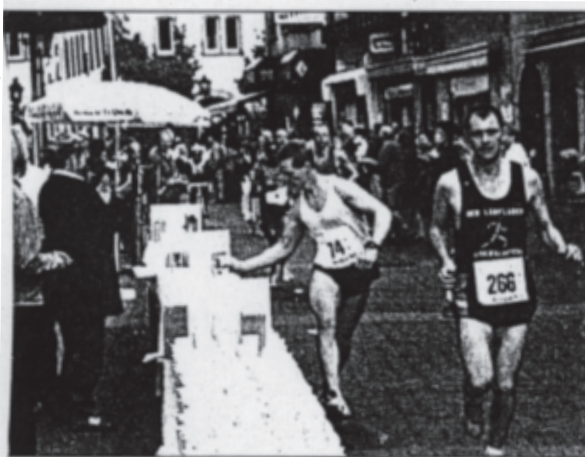
Erfrischung am Wegrand: Die Teilnehmer am ersten Weinstraßen-Marathon griffen unterwegs gerne zu (wie hier in Grünstadt), um ihren Flüssigkeitsverlust auszugleichen.