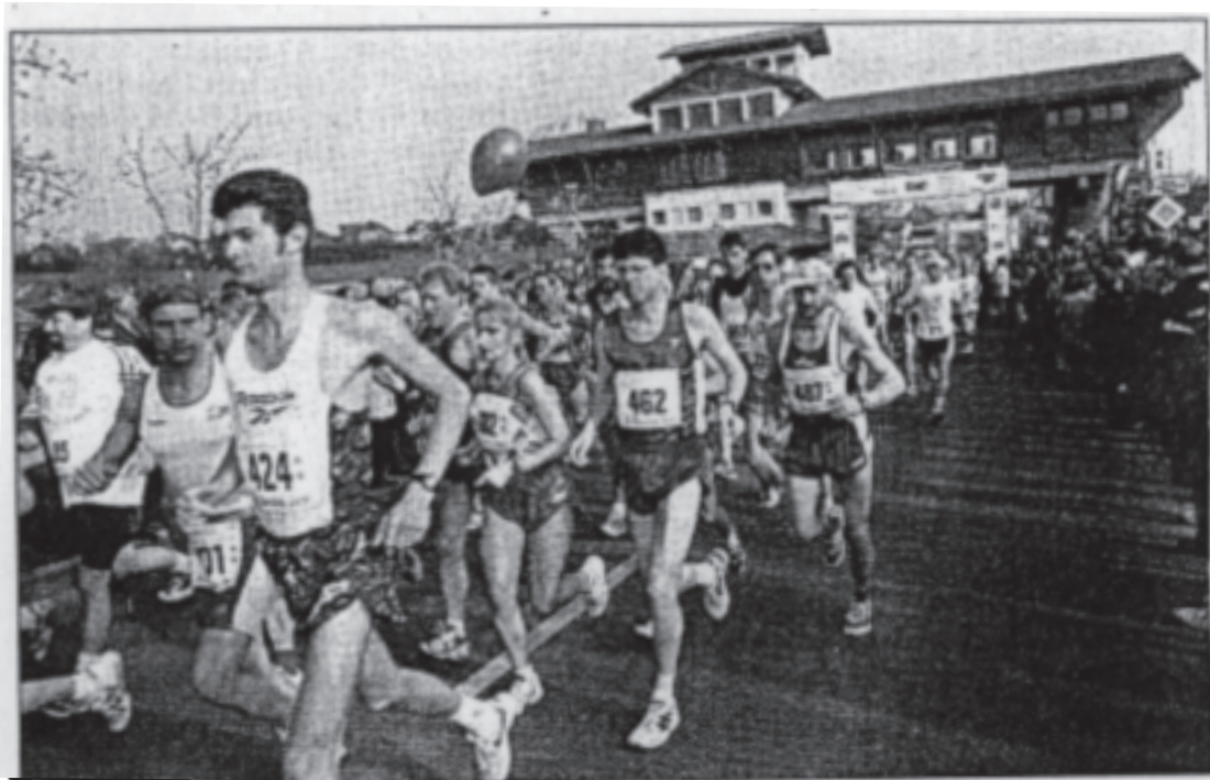
Gut trainiert starten die Marathonläufer am Haus der Weinstraße.