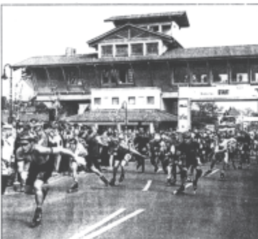
Fünftausend haben sich an der Die kleine Saale, die nach der März-Überflutung vom März (Planung nach Osttag) platziert